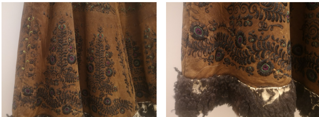
25-26. kép: Kunsági női kisbundán megfigyelhető a színek változása: lila és zöld színeket is használtak, de már a fekete dominált. Damjanich Múzeum

A hímezésre selyemfonalat használtak, jellegzetes színei kezdetben az aranybarna, kétféle zöld, lila, kék, fekete, rózsaszín voltak. Egy motívumon belül is kedvelték az elütő színeket. Később a hímezés sötétebb lett, először az aranybarna színt „tompították”, majd hagyták el fokozatosan a többi színnel együtt. Végző fázisában a hímezés sötétbarna, fekete lett. A sötétbarna alapon fekete hímezés a női kisbundákra volt leginkább jellemző. 41