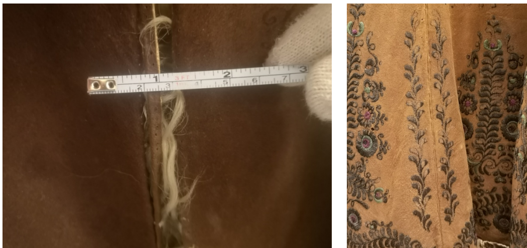
14-15. kép: A bőr színével megegyező vó látható egy szakaszon kibomlott, és bevarrt állapotban egy kunsági kisbundán. Damjanich János Múzeum

A „vócos subáknál” egy keskeny, összehajtott bőrcsíkot varrtak a bőrök közé, ami a cérnák kopásának megelőzésére szolgált, egyben díszítő funkciót is ellátott. Az irhacsík és a vó is lehetett elütő színű, vagy az alapszínnel megegyező is, de annál fényesebb. 19