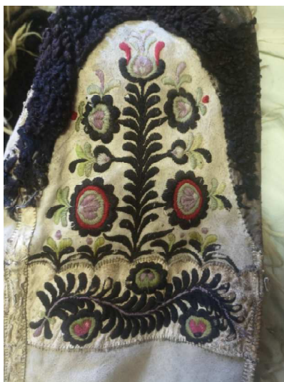
11. kép: Kereszt-és szálirha színes kunsági subán. A keresztirha gazdagon hímzett. Déri Múzeum

Az így kivágott rátéteket a szűcs apró öltésekkel a bőrre varrta. Gyakran alkalmaztak szálvezetést is, felvarrás közben a rátétet másik cérnával, zsinórral kontúrozták. Hímzés kerülhetett a rátétre is. 18