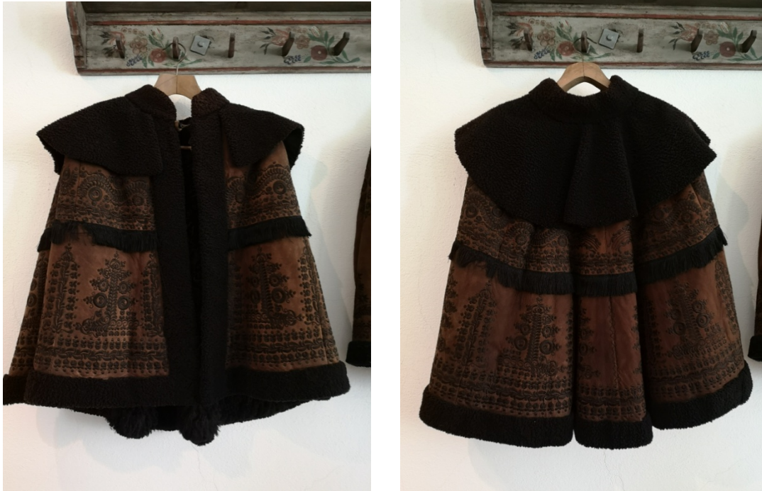
9-10. kép: Kunsági típusú kisbunda, Damjanich János Múzeum