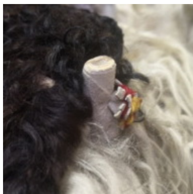
21. kép: Hosszúkás, tekert furkógomb egyeki subán. Déri Múzeum

Ezeket díszíthették színes gyapjú bojtocskákkal vagy keskeny irhacsíkokkal. A bujtató összesodrott irhacsík volt, vagy sallang. Ritkábban idegen anyagokat is használtak, pl. fémgombot, pitykét. 30