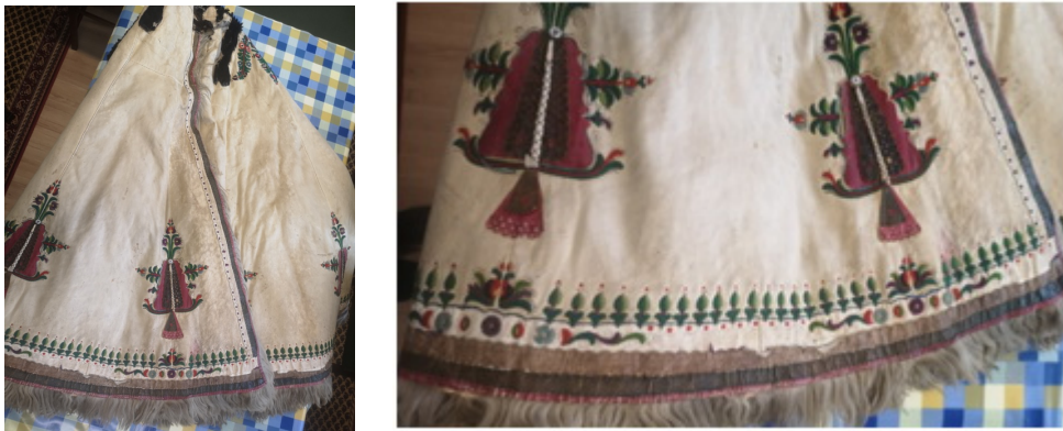
7-8. kép: Jászárokszállási színes hímzésű vócos suba. Jól látható, hogy nincs válltányérja. Az alján lévő gombcifrák a kötözött aljú subák emlékét őrzik. Jász Múzeum

Ez a „vócos suba”. A varrásokat a bőrök összetoldásánál alkalmazott bevarrt bőrcsíkok, vóccok erősítik. Mivel nincs válltányérja, az oldalát képező bőrök magasabbra érnek és így keresztirhája sincs. A tányérra való mintát közvetlenül a bőrre varrják, gyapjúhímzéssel. A virágdíszek általában a gallér alól indulnak és lefelé irányulnak. A szálirhák alján gombcifra, vagy alj-rózsa található, de mivel a suba alja már nem felhajtható, rendeltetésétől ez a díszítés már elszakadt. A bőr alapszíne általában sárgás. Ez a típus jellemző az Alföld déli részére.