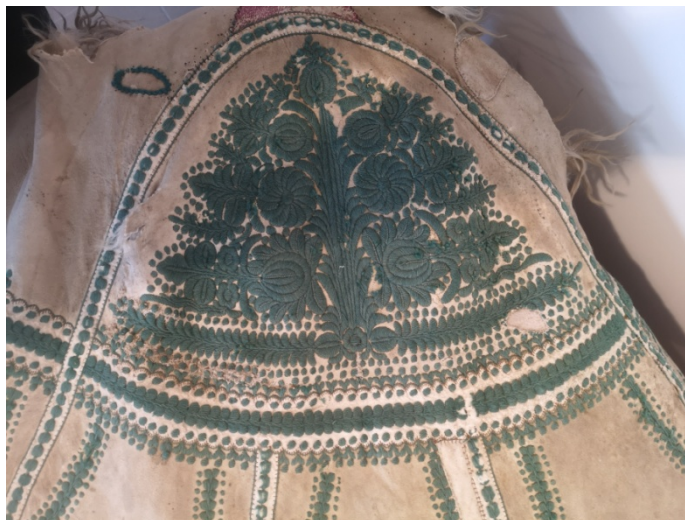
23. kép: Jászsági suba zöld színnel kivarrt válltányérja, Jász Múzeum

A Jászság fontos szücsközpont volt, Jászberényben és a környező településeken (Jászárokszálláson, Jászapátiban) 1852-ben 430 szücsmester dolgozott. Később ez a szám tovább emelkedett, 1880-1890 között csak Jászberényben 300 szücs dolgozott.