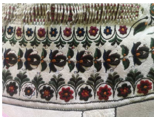
18. kép: A hímzett virágsorok fölött szironyszálból sakktáblaszerűen befűzött minta szegélyezi a békéscsabai suba válltányrját. Déri Múzeum

Rácsos mintát is alakítottak ki vele olyan módon, hogy a rátétnek használt irhát egyenletes közökkel bevagdosták és ebbe fűzték bele a szironyszálát, ami sakktáblaszerű mintát eredményezett.