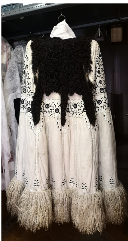
22. kép: Fekete hímzéssel díszített egyeki suba. Déri Múzeum

A térség természeti adottságai, a kiterjedt legelők bőséges alapanyagot szolgáltatottak a bőrruhák készítéséhez. A debreceni szűcsök már 1405-ben céhet alkottak. Számuk a 18. században 100-120 fő volt. A környező városokban is – Hajdúböszörmény, Hajdúhadház, Hajdúszoboszló, Hajdúnánás, Derecske,