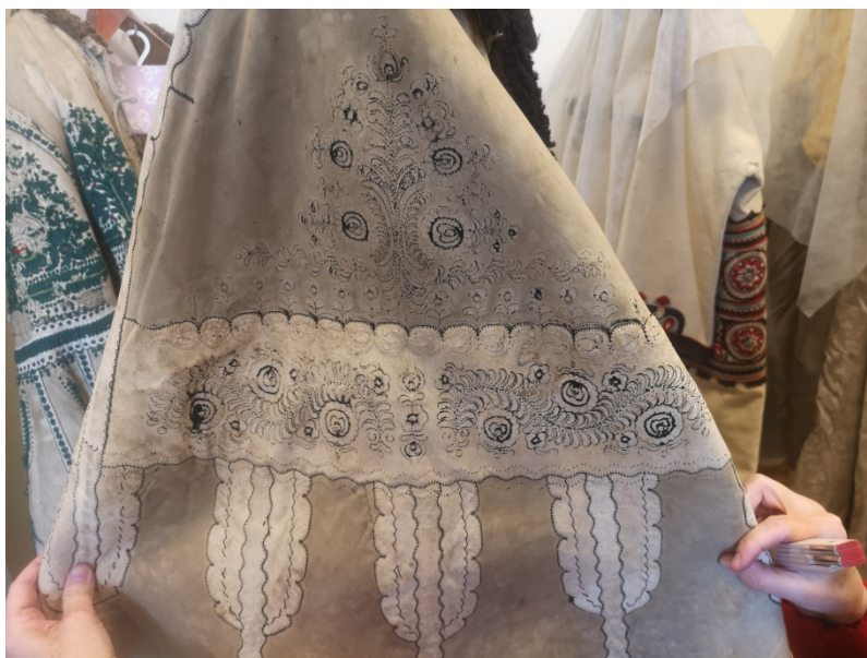
16. kép: Ezen a subán bár lekopott a hímzésre használt cérna, jól látható, milyen lehetett a bőr a minta felvitele után. Kunsági irhás suba, Damjanich János Múzeum

A kikészített (megfestett) bőrökre rárajzolták a szabásmintát, majd a mintát előrajzolták. A subát csak a hímzés után szabták ki.