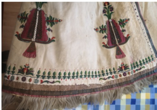
20. kép: Díszes gombcifra, funkcióját elvesztve díszitménnyé vált. Jászsági vócos suba, Jász Múzeum

Később, mikor a subák alja nem volt felgombolható, ez a fajta díszítés akkor is megmaradt. Először irhából kivágott kerek, cakkozott szélű rózsa került a gomb helyére, később ezt az alakot a subára ráhímezték. Neve almarózsa vagy gombcifra.