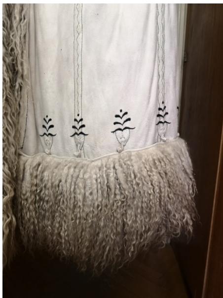
19. kép: Egyeki felgombolt aljú suba gombbal és gombcifrával. Déri Múzeum

Egyes subák alja arasznyira felgombolható volt, így kevésbé lett sáros esős időben. Ezt egyenlő távolságokban elhelyezett kis gombokkal érték el. A gombok alatti részt is díszítették, jellemzően szív alakú apró rátétekkel, körülvéve hímzéssel.