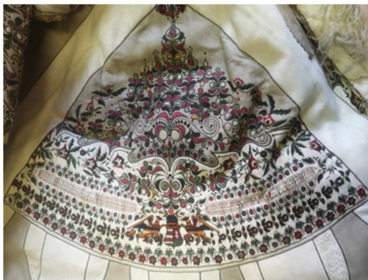
13. kép: A fehér keresztirha is mintát képez a békéscsabai suba válltányérján. Déri Múzeum

Az irhaszegély egész mintává is kiteribélyesedhetett, ez már átmenetet képezett a rátétdíszítményekhez.