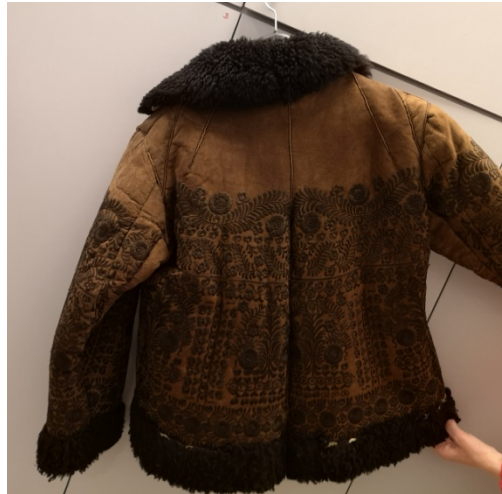
2-3. kép: Bekeccsé átszabott kunsági típusú kisbunda. Díszítése az egykori kisbunda szerkezetét mutatja. Damjanich János Múzeum