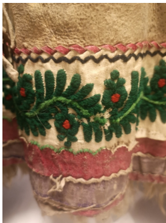
17. kép: Szegély felvarrása irhaszállal. A vörös irhaszegély felvarrásánál jól látható a zöld színű szálvezetés is. Jászsági vócos suba, Jász Múzeum

A szironybőr egy 2-3 mm vékony bőrcsík, amit gyakran használtak irhaszegély levarrására, irhafolt rögzítésére. Győrffy István írása szerint ezt leggyakrabban macskabőrből készítették, és színezték. A bőrt vésőszerű tűvel szúrták át a varrás vonalához képest ferden, ebbe fűzték a szironyszálát, így az öltés lépcsőzetesen haladt. 28