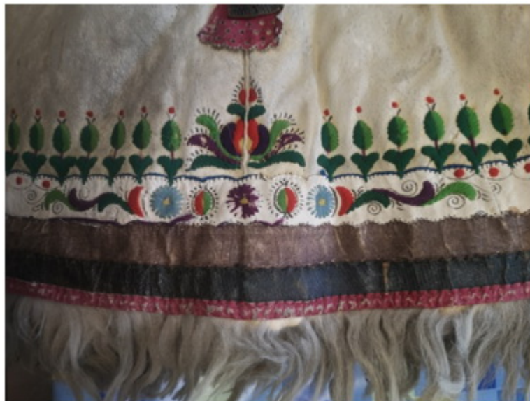
12. kép: Jászsági vócos suba alján futó, hullámos fehér irhacsík. Jász Múzeum

Az „irhás subák” esetében függőleges rátétcsík került a bőrok összevarrásának az eltakarására is (szálirha), ez egyben a varrást is erősítette. Irhaszegély futhatott vízszintesen is, a váll alatti részeken (keresztirha) és a suba alján is. Széleit is díszíthették, gyakran hullámosra, „vízfolyásosra”, „almásra”, stb. vágták.