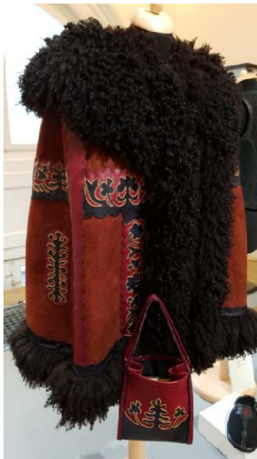
1. kép: „Böszörményi kisbunda” – vizsgamunkám a Népi Iparművészeti Múzeumban

Édesapámtól hallottam, hogy a dédnagymamám is büszkén hordott kisbundát. Neki „kunsági típusú” sötét vörösbarna alapon fekete selyemcérnával gazdagon kivarrt kisbundája volt, ami leginkább a református lakosság körében volt elterjedve. Sajnálatos, hogy később ennek a kisbundának nyoma veszett.