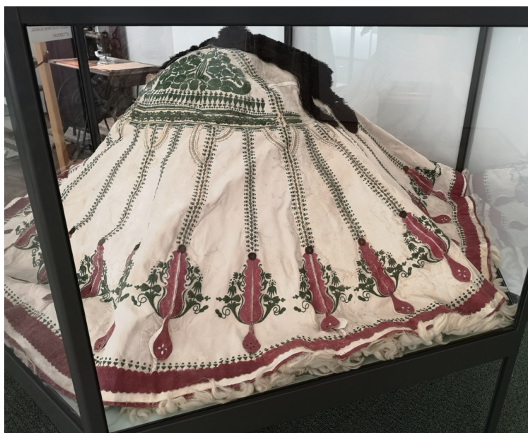
6. kép: Jászapátiban készült irhás suba. Hátrészen jól látszik a külön szabott váll. Damjanich János Múzeum

Ez az „irhás suba”. Szerkezetében és díszítésében is ez a legkövetesebb típus. Válltányérja gazdagon hímzett. A keresztirhaból induló virágmotívumok felfelé törekszenek. Vállának, válltányérjának, elejének és hátuljának az összevarrása nincs mindig egy szinten, így a keresztirha sem alkot összefüggő kört. A bőr alapszíne fehér, hímzés kerül az irhaborításra is. Használata jellemző volt a Jászságban, Duna-Tisza között, Szegeden, Hódmezővásárhelyen.