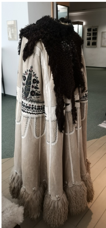
24. kép: Kunsági irhás suba, Damjanich János Múzeum

A Nagykunság is igen jelentős szűcsközpont volt a következő településekkel: Karcag, Kisújszállás, Kunhegyes, Kunmadaras, Túrkeve, Kunszentmárton, Mezőtúr.